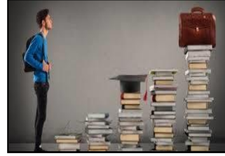
تحديد الأهداف الشخصية