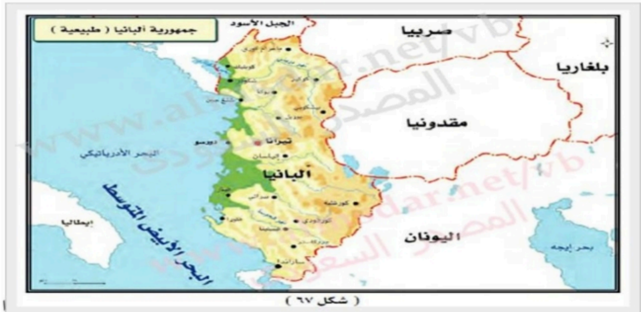
( شكل ٦٧ )

ب/ امامك خارطة لجمهورية البانيا الإسلامية تأملى الخارطة واجيبى عن التالى؟